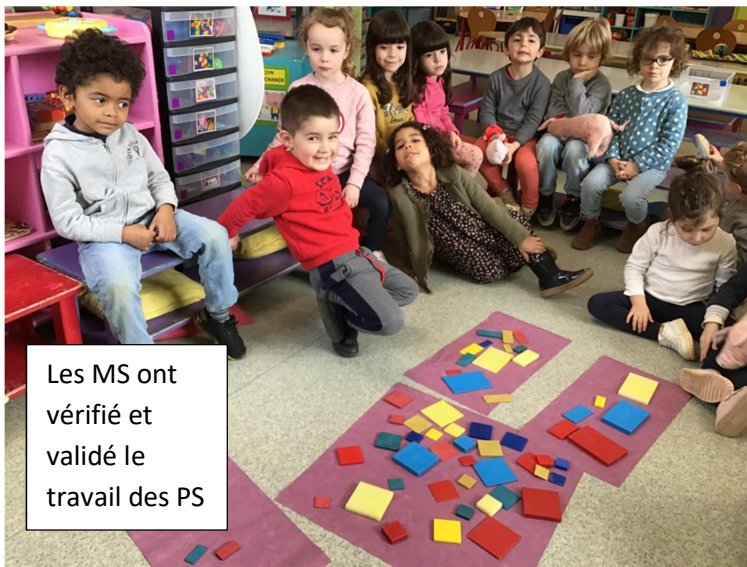
Les MS ont vérifié et validé le travail des PS