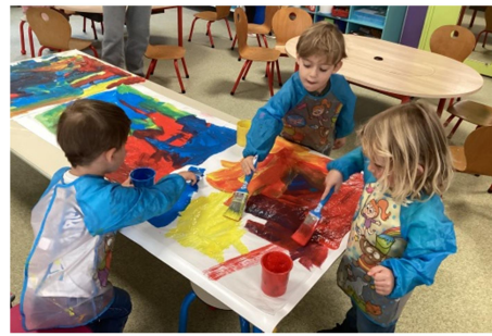
On a observé que des nouvelles couleurs étaient apparues. On a pensé à un mélange...