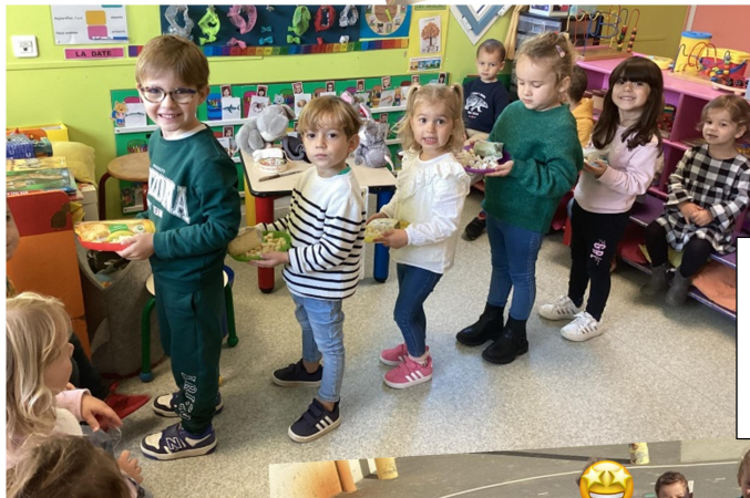
On a préparé un buffet pour les enfants des autres classes. Les GS avaient préparé des cakes au gruyère.