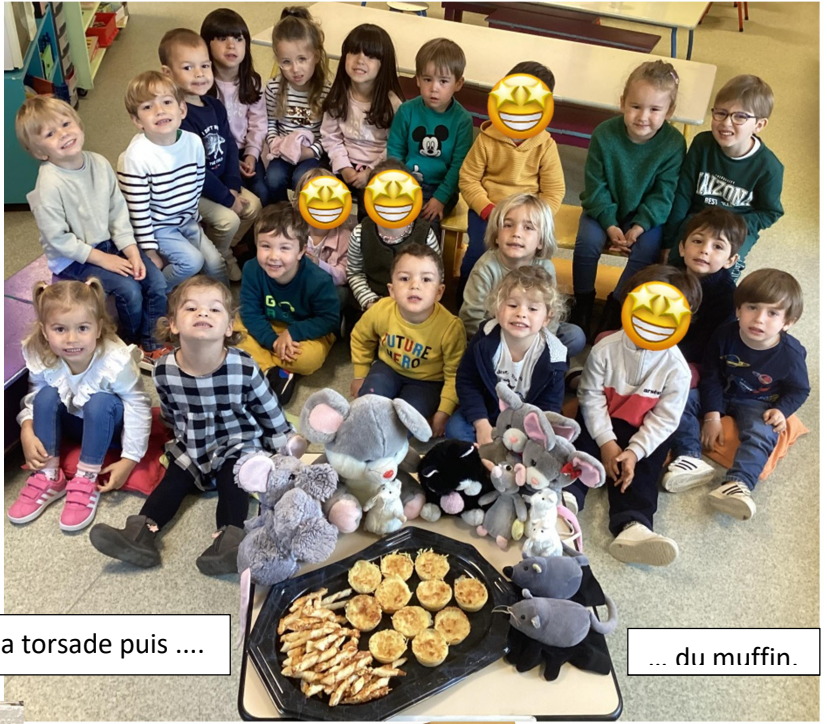
Nous avons posé très fiers avant la dégustation de la torsade puis ....