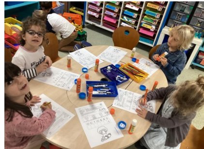
Les MS ont écrit OCTOBRE