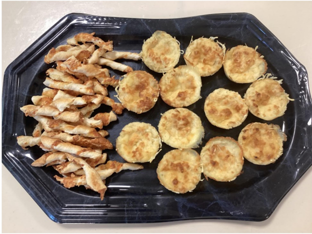
La maîtresse a cuit nos torsades et nos muffins. Nous voilà mis en appétit !